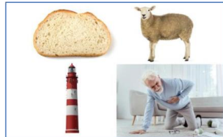
Mie / Laine / Phare / Meurt : Mylène Farmer