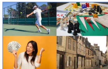
Sert/Jeux /Gains /Bourg : Serge Gainsbourg