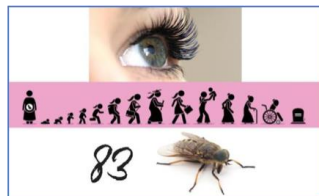
Cil / Vie / Var / Taon : Sylvie Vartan