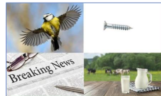
Ailes/Vis / Presse/Lait : Elvis Presley