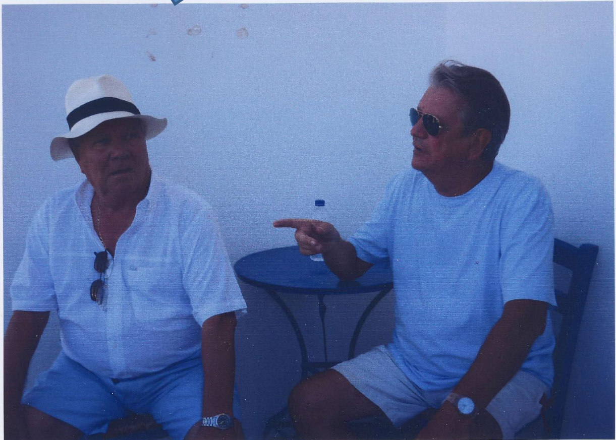
Zorbec le gras